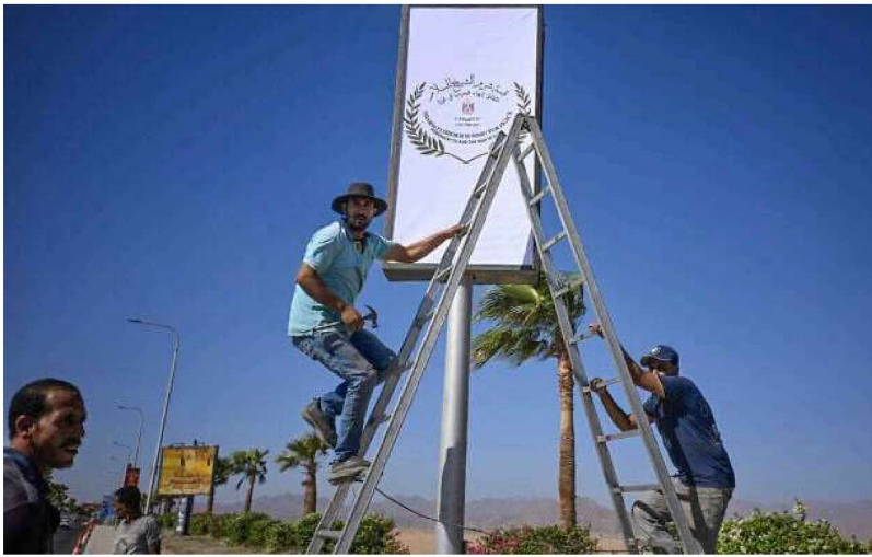
Municipal workers hang a sign near the airport in Sharm el-Sheikh, as the Egyptian Red Sea resort prepares to host a US-brokered International Gaza peace summit, on October 12, 2025.

The summit will take place after Trump's visit to Israel and Hamas's release of the hostages.