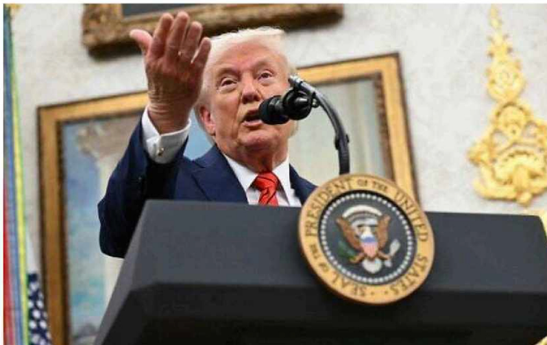
US President Donald Trump announces a deal to lower drug prices with drug maker AstraZeneca at the Oval Office of the White House in Washington, on October 10, 2025.

However, it is unclear how the summit itself can formally end the war. Israel has said it will not agree to end the war until it is satisfied that Hamas no longer poses a threat and has no part in the rule of Gaza.