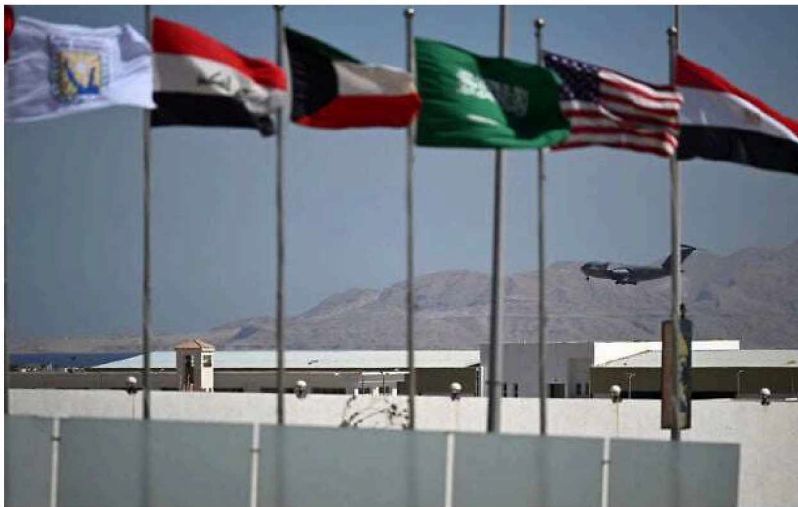
Flags of several countries flutter as a US military aircraft prepares to land in Sharm el-Sheikh, ahead of the arrival of international leaders to the Egyptian Red Sea resort, following a Gaza ceasefire agreement, on October 11, 2025.

Representing international organizations, UN Secretary-General Antonio Guterres and European Council President Antonio Costa will also attend.