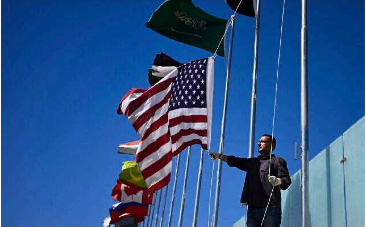
A municipal worker hoists a US flag next to those of other countries near Sharm el-Sheikh International Airport ahead of the arrival of world leaders for a "peace summit" in Sharm el-Sheikh on October 11, 2025.

Egypt will host an international summit in the Red Sea resort city of Sharm el-Sheikh on Monday to finalize an agreement aimed at ending the war in Gaza, an Egyptian presidential spokesperson said on Saturday.