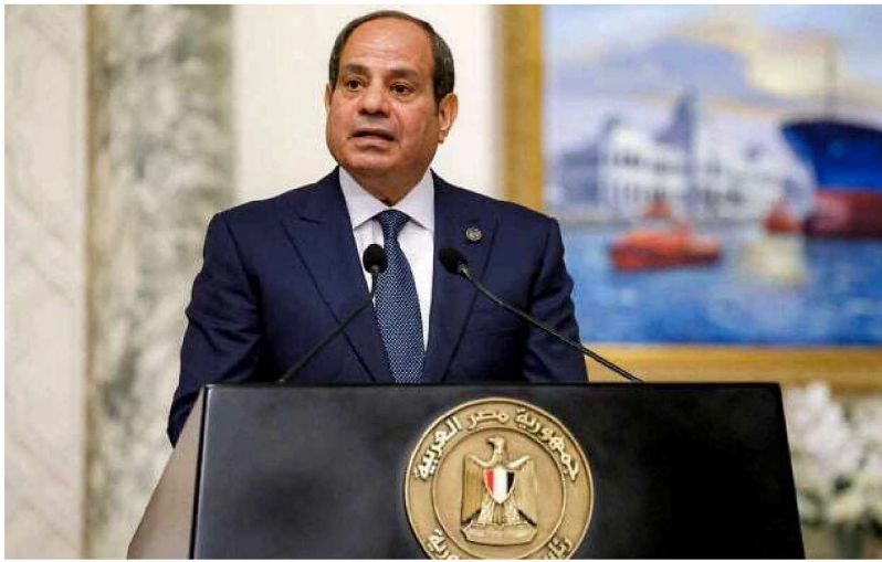
Egypt's President Abdel-Fattah el-Sissi speaks during a press conference after his meeting with the French president at the Presidential Palace in Cairo, Egypt, on April 7, 2025.

The outlet reported that the US State Department issued official invitations to the leaders' summit, and has significantly expanded the list of invitees to include Spain, Japan, Azerbaijan, Armenia, Hungary, India, El Salvador, Cyprus, Greece, Bahrain, Kuwait and Canada.