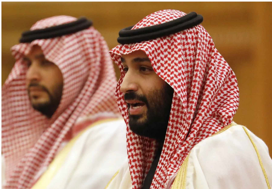
[FOTO] Crown Prince Mohammed bin Salman

Israel must understand. Saudi Arabia and the UAE made it clear in advance that their participation in the Gaza rehabilitation plan is based on one simple condition: disarming Hamas and ousting it from Gaza as a movement.