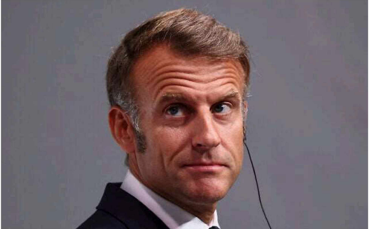
French President Emmanuel Macron attends a joint press conference with German Chancellor Friedrich Merz in Toulon, southern France, August 29, 2025.

French President Emmanuel Macron will travel to Egypt on Monday to back the Gaza ceasefire and hostage deal brokered by the United States, and to discuss implementation of its next phases, the Elysee Palace says.