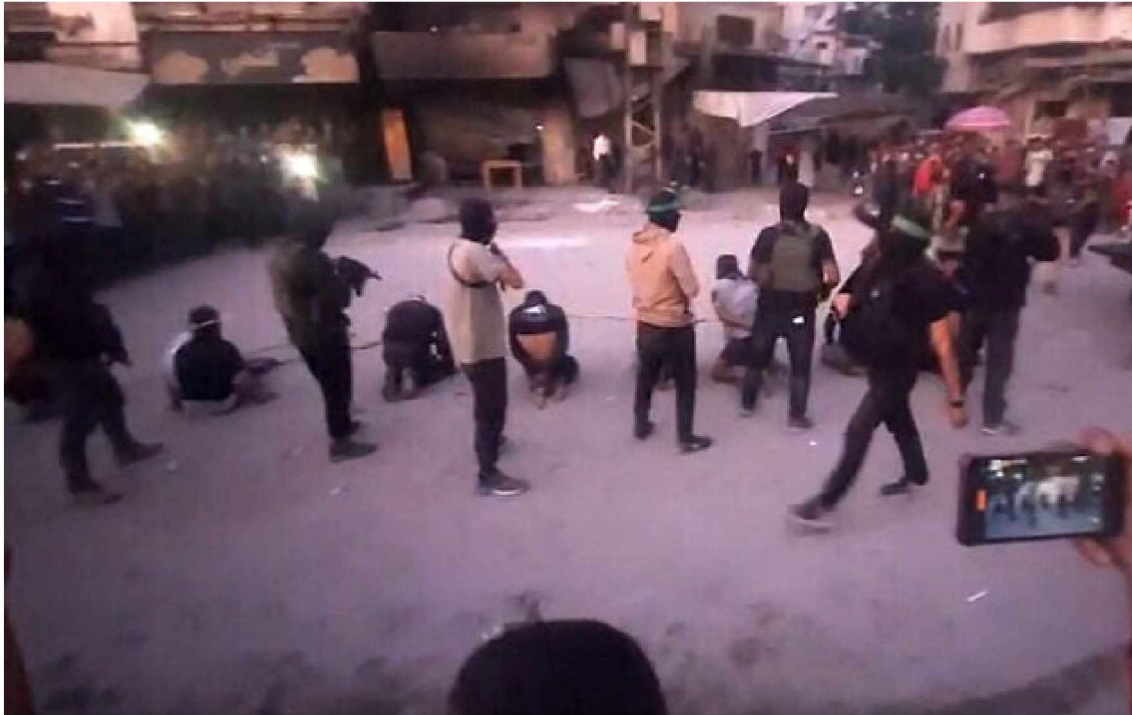
This image grab from a handout video released by the Hamas-run al-Aqsa TV's Telegram channel on October 13, 2025, shows Hamas gunmen executing blindfolded, bound and kneeling men as a crowd surrounds them in a street in Gaza City.

This was why Washington decided to split Trump's 20-point plan for ending the Gaza war into two, and managed to secure an agreement between Israel and Hamas on a ceasefire, Israel's initial withdrawal, post-war humanitarian aid provisions, and the terms of a hostage-prisoner exchange — all of which have been branded as phase one.