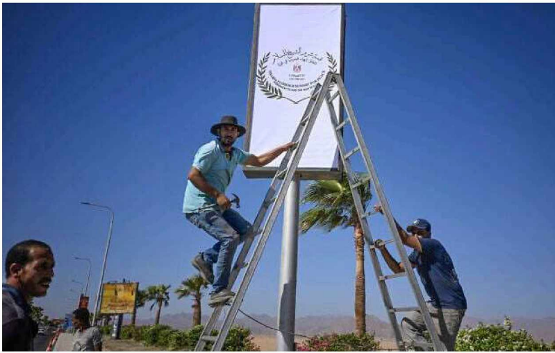
Municipal workers hang a sign near the airport in Sharm el-Sheikh, as the Egyptian Red Sea resort prepares to host a US-brokered International Gaza peace summit, on October 12, 2025.

The summit will take place after Trump's visit to Israel and Hamas's release of the hostages.