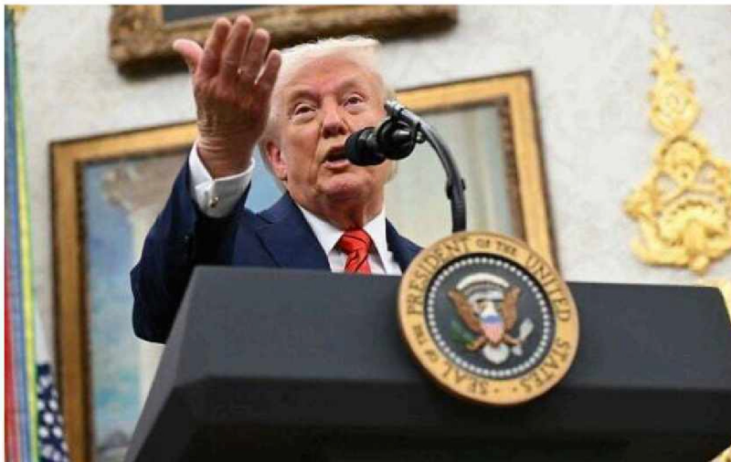
US President Donald Trump announces a deal to lower drug prices with drug maker AstraZeneca at the Oval Office of the White House in Washington, on October 10, 2025.

However, it is unclear how the summit itself can formally end the war. Israel has said it will not agree to end the war until it is satisfied that Hamas no longer poses a threat and has no part in the rule of Gaza.