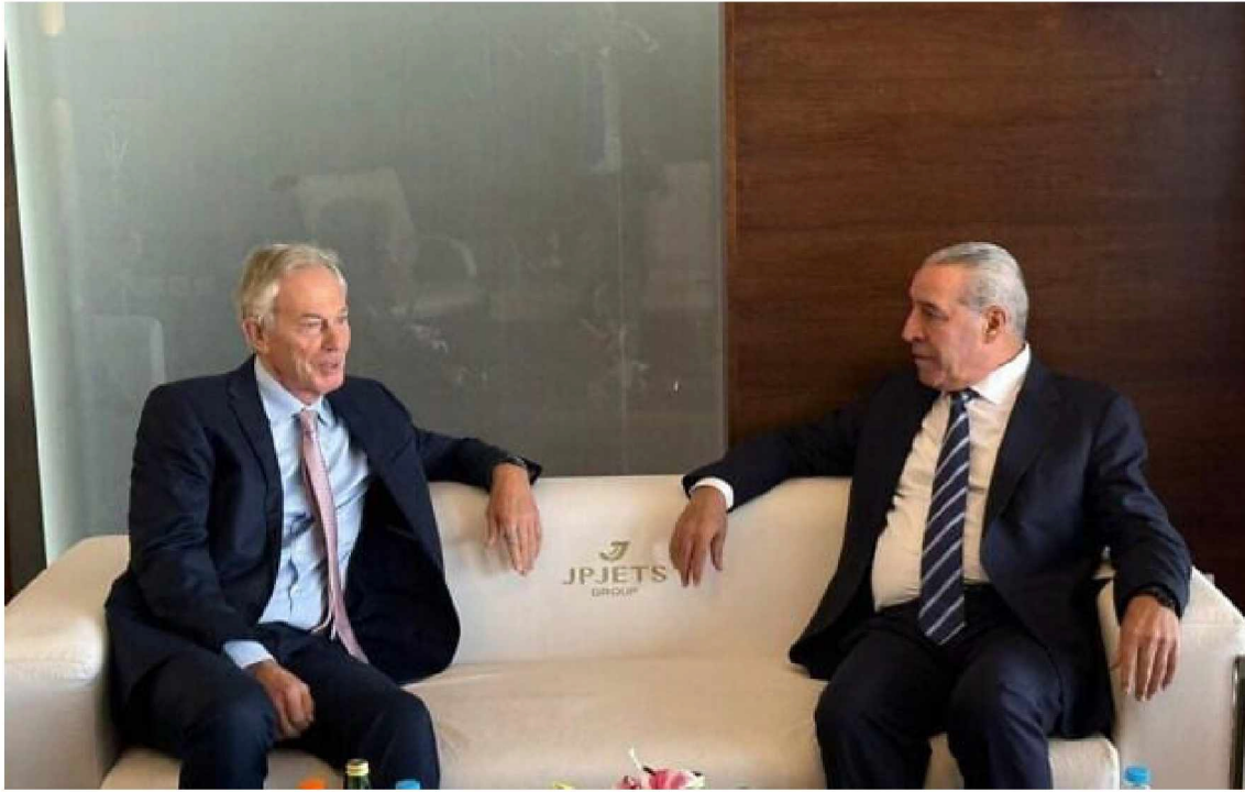
Former UK prime minister Tony Blair (L) meets with Palestine Liberation Organization Vice President Hussein al-Sheikh in Jordan on October 12, 2025.

Notably, Trump claimed that he “gave them approval for a period of time” to carry out the killings, asserting that Hamas was targeting some “very bad gangs.” Subsequently, though, the commander of US forces in the Mideast called on Hamas to immediately stop attacks on “innocent Palestinian civilians.”