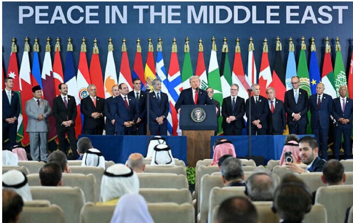
US President Donald Trump (C) speaks during the Sharm El-Sheikh Peace Summit in the Egyptian Red Sea resort town of Sharm el-Sheikh on October 13, 2025.

“ We’re going slowly on that,” the senior adviser said when asked whether the US had specific names in mind for who can serve on the transitional Gaza administration.