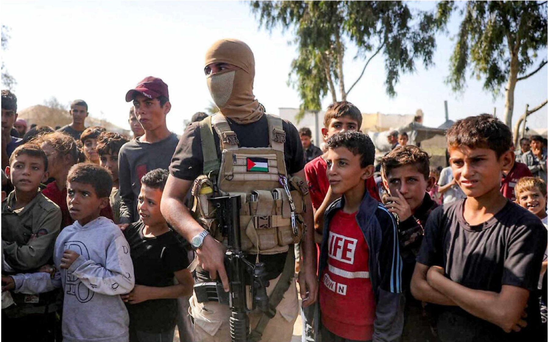
A masked member of the Hamas military wing stands guard next to children in the south of Deir el-Balah in the central Gaza Strip on October 13, 2025.

The US and Middle Eastern mediating countries are working to put together a committee of Palestinian technocrats responsible for the postwar management of Gaza, while the pullback of Israeli forces from deep inside the enclave has allowed Hamas to reassert its control in the Strip.